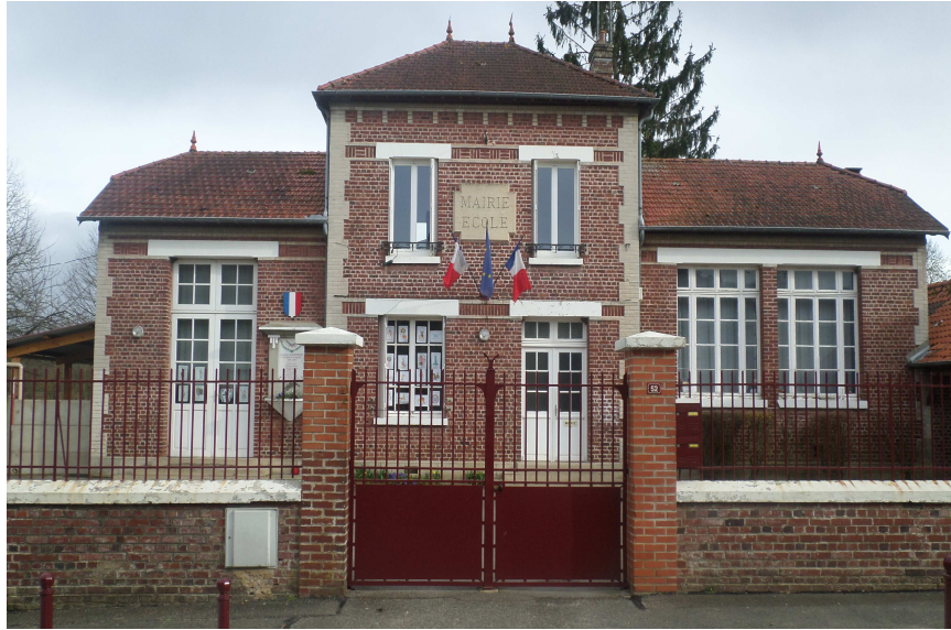
La mairie et l'école de Vignemont