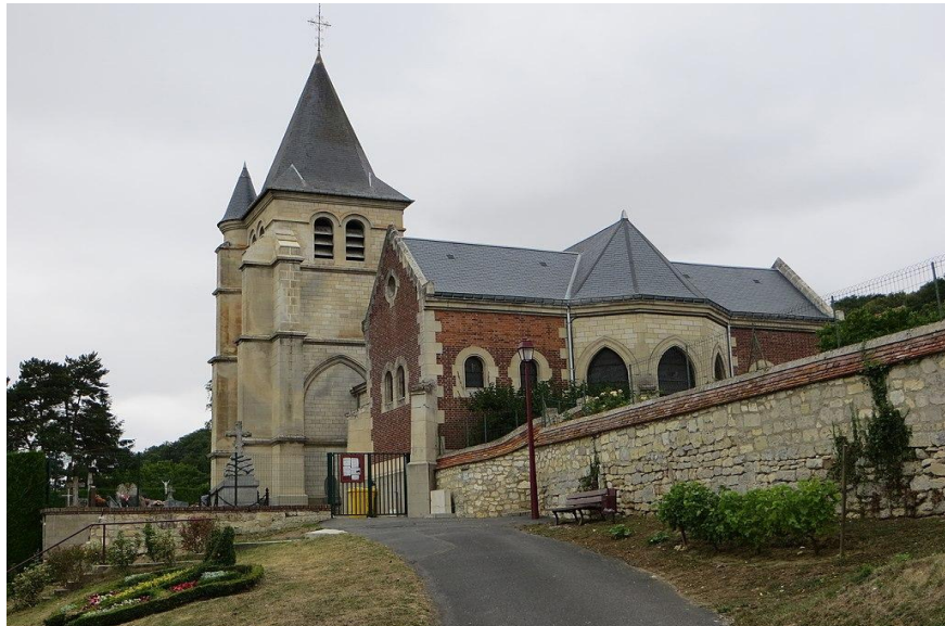
L'église de Vignemont