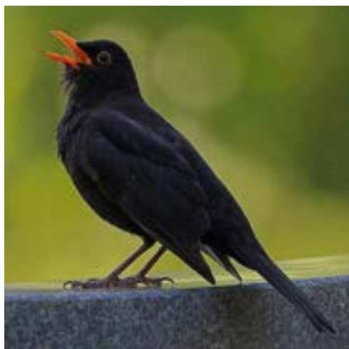
Le Merle Noir

Afin de ne pas déranger les couvées, la LPO recommande donc d'arrêter de couper les haies et d'élaguer dès le début du printemps et d'attendre l'envol des derniers oisillons, soit au plus tard fin août.