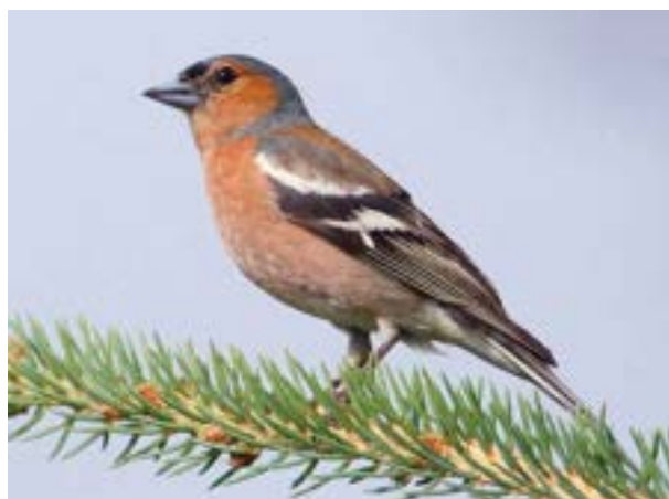
Pinson des arbres