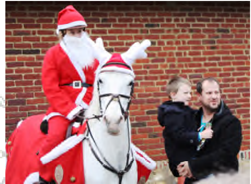
Distribution de friandises par le Renne de Noël et son cavalier ! Les Vignemontois sont gourmands...