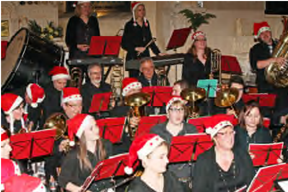
Concert de Noël en l'église de Vignemont... Les Vignemontois sont traditionnels...