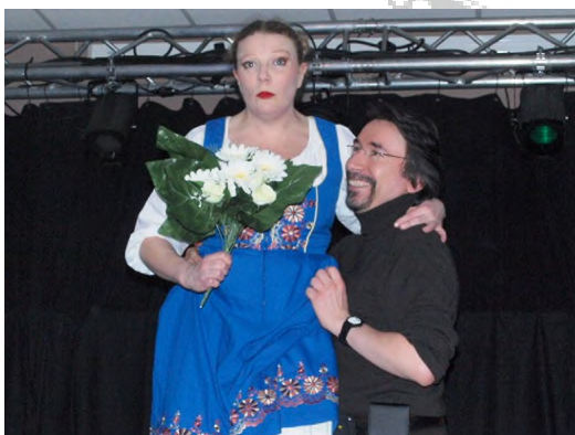
Spectacle organisé par le Pays de Sources et Festi Vignemont. Les Vignemontois aiment la dérision...

Suite au remaniement ministériel de Vignemont, une nouvelle présidente a été élue :