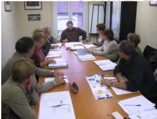
Assemblée générale de Festi Vignemont Et oui, il faut bosser parfois...