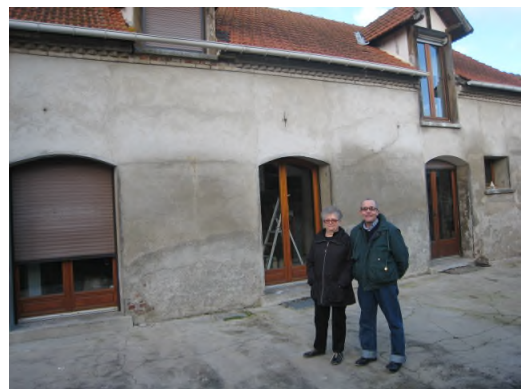
Mr Mme Olive, 101 rue des Fontaines